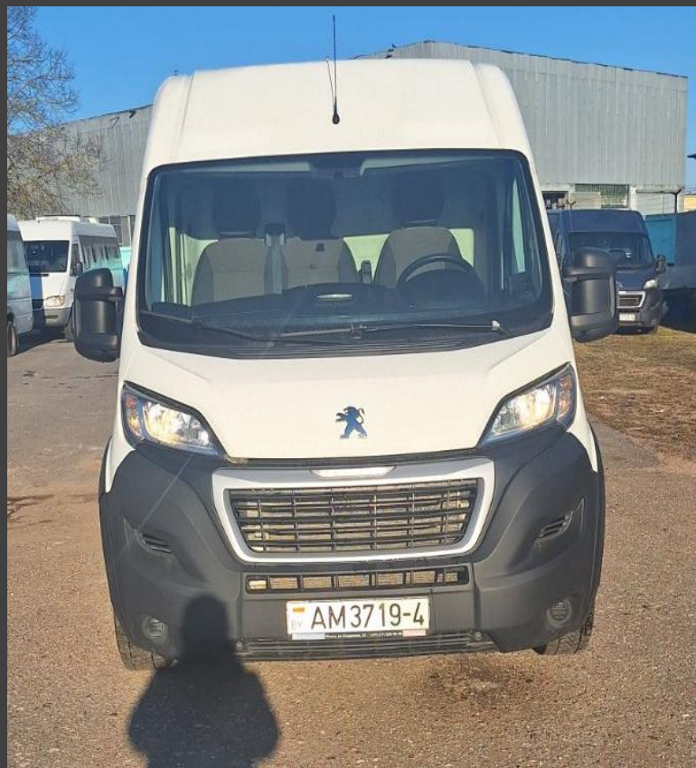
Фото автомобиля грузового вагон (wagon) (Peugeot Boxer, рег. знак AM 3719-4, 2020 г.в.)